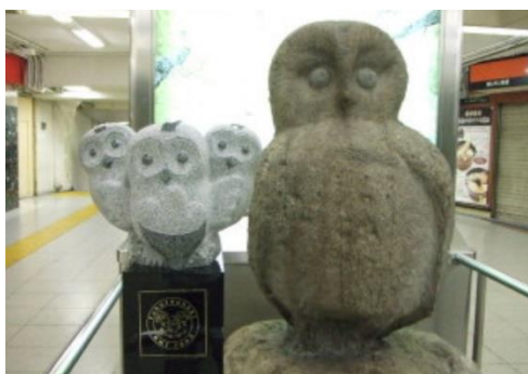
池袋のシンボル いけふくろうの像