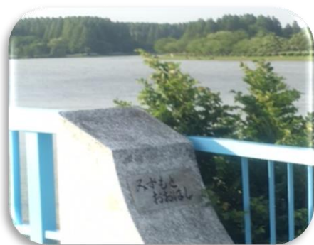
(水元公園中央付近の橋)

葛飾区にあるとても大きな公園、『水元公園』は、東京23区中でも最大規模の面積の水郷公園で、四季折々の眺めはもちろんのこと、いろいろな野鳥が生息していて、訪れる人々を自然に親しませてくれます。