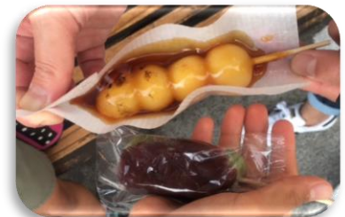
(熱々のみたらし団子と草団子)

参道には、『男はつらいよ』で実際にモデルとなった『高木屋老舗』というお団子屋さんがあります。このみたらし団子と草団子はとても美味しいです。特に私の好きなみたらし団子は、店頭で焼いてくれて、その場で熱々のみたらし餡をかけてくれます。