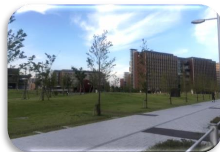
(公園と一体化しているキャンパス)

大学の学生食堂やカフェは一般の人でも利用でき、大学図書館も手続きをすれば利用することができます。今や、金町駅前の通りは、「理科大通り」と名付けられ、1日を通して多くの人々が行き来をしています。