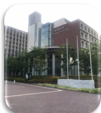
(葛飾キャンパス正門)

平成25年2月20日に、『東京理科大葛飾キャンパス』の竣工式が行われました。三菱製紙工場の跡地に建設されたもので、大学と隣接する「葛飾にいじゅく未来公園」と一体化した『学園パーク型キャンパス』となっており、約33万㎡が再開発されました。キャンパスには塀がないため、とても解放感があります。