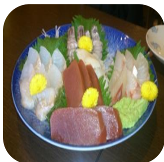
(刺身の盛り合わせ)

メニューは築地から直送される新鮮なお刺身を始め、揚げ物・焼き物・焼き鳥等の種類も豊富です。