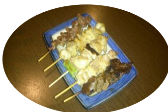
焼き鳥 1本 130円