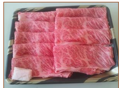
おいしそうなお肉のお礼品 (山形県最上町)