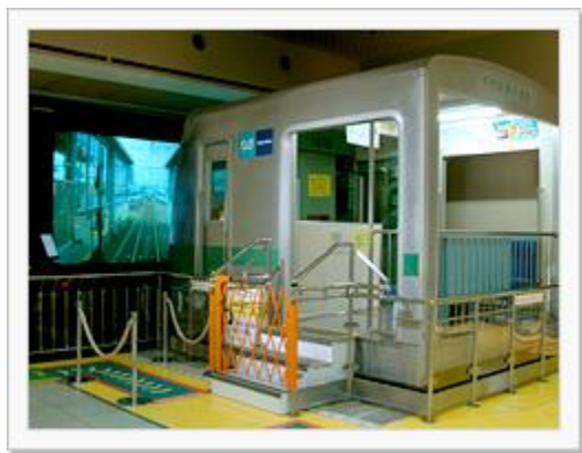
本物と同じシミュレーター

西葛西駅の隣の葛西駅の高架下には、地下鉄博物館があります。地下鉄の歴史や地下鉄はどのようにできるのか、など学ぶことができます。運転台が本物と同じ運転シミュレーターがあり、子供はもちろんのこと大人も楽しめます。運転している人も一般座席の人も結構楽しめる映像です。