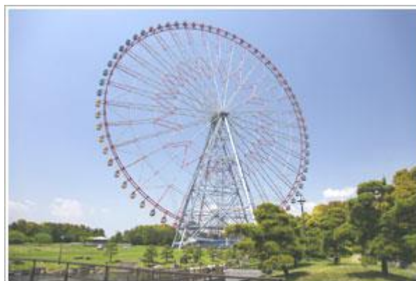
ダイヤと花の大観覧車

この公園の名物の一つが、日本最大の観覧車です。この観覧車は、先月終了したTBSドラマ「夜行観覧車」のロケ地だったそうです。ドラマの主人公の鈴木京香や高橋克典になった気分、観覧車に乗るのも良いかも知れません。